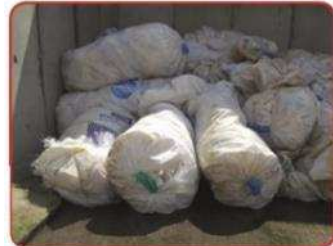
Déchets mis dans des big bags