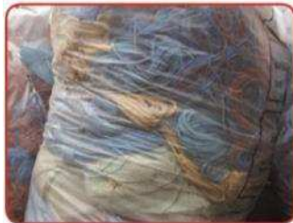
Déchets mélangés dans le même sac