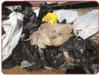
Films en mélange, en vrac, non ficelés.