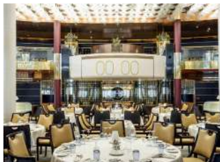
Grand Restaurant Vatel