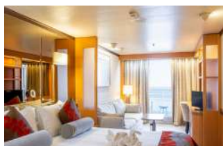
Cabine Balcon (en supplément)

• Le Renaissance, un bateau 5* battant pavillon français, 100% francophone .