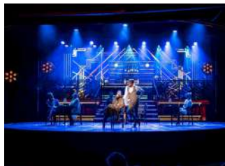
Théâtre La Belle Epoque